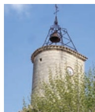
Tour de l'horloge

Tous les samedis matin : grand marché de producteurs sur l'Esplanade et la place du Jeu de Ballon.