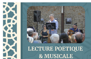
LECTURE POÉTIQUE & MUSICALE