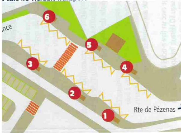
s cars liO Hérault Transport

Quai 1 - Direction Montpellier - Lignes 661 662 663 665 685 681